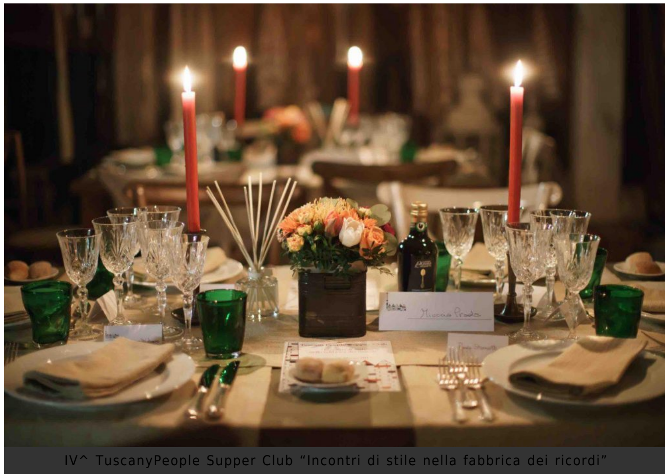
IV^ TuscanyPeople Supper Club "Incontri di stile nella fabbrica dei ricordi"

Firenze - rimane segreta fino a poche ore prima dal suo inizio.